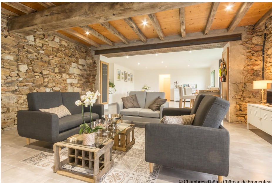
© Chambres d'hôtes Château de Fromenteau