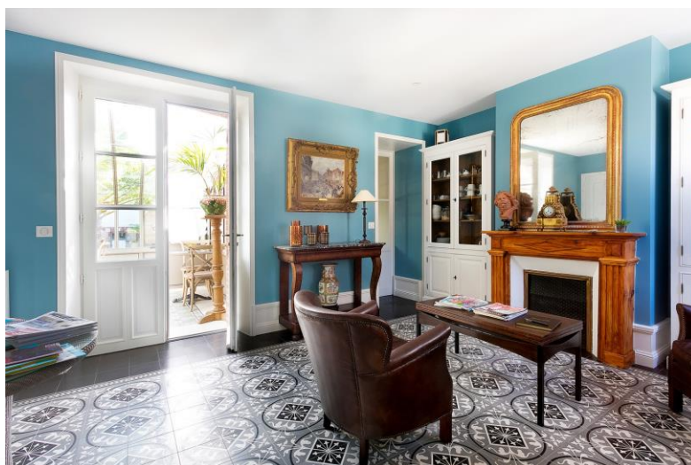
La Ruche – La Baule

Date et horaire à définir ensemble selon vos disponibilités entre le 15 mars et le 29 mars 2021.