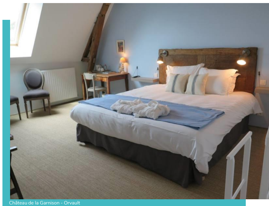
Château de la Garnison - Orvault

Date et horaire à définir selon vos disponibilités entre le 1 er avril et le 22 avril 2021, l'intervenant prendra directement contact avec vous pour fixer le rendez-vous (report possible du rendez-vous selon l'évolution de la crise sanitaire).