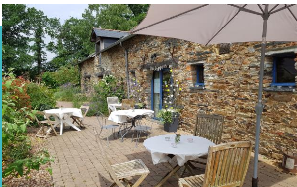
Gîte du Chêne Blanc - Plessé